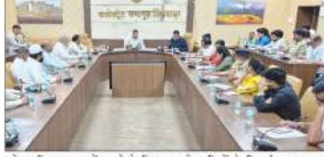
यूथ प्रॉपेट • छिंदवाड़ा