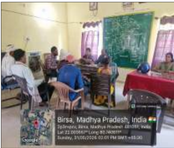
के लिए आवश्यक कृषि यंत्रों की उपलब्धता सुनिश्चित करने के निर्देश दिए गए। इस अवसर पर कृषि विभाग द्वारा ऐप के माध्यम से कृषि यंत्रों की ऑनलाइन बुकिंग, उपलब्धता की जानकारी प्राप्त करने तथा अन्य सुविधाओं के उपयोग की प्रक्रिया समझाई।

उपलब्धता की समीक्षा की गई। कृषि अधिकारियों ने सभी संचालकों को निर्देशित किया कि आगामी खरीफ सीजन में किसानों को आवश्यक कृषि यंत्र समय पर उपलब्ध कराए जाएं, जिससे कृषि कार्यों में किसी प्रकार की बाधा उत्पन्न न हो। बैठक में खरीफ मौसम 2026 के दौरान डायरेक्ट सीडेड राइस (डीएसआर) पद्धति को प्रोत्साहित करने पर विशेष जोर दिया गया। अधिकारियों ने कहा कि डीएसआर तकनीक धान उत्पादन की आधुनिक एवं लाभकारी पद्धति है, जिससे पानी, श्रम और लागत की बचत होती है। इस तकनीक को अधिक से अधिक किसानों तक पहुंचाने