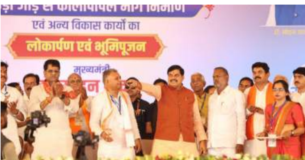
Chief Minister Dr. Yadav Inaugurates Four Sandipani Schools, Maa Sharda Sandipani Vidyalaya, Maharana Pratap Sandipani Vidyalaya, Mihir Bhoj Sandipani Vidyalaya and Raja Bhoj Sandipani Vidyalaya, constructed at a cost of ₹122 crore. Four new Primary Health Centres built at a cost of ₹14.58 crore were also inaugurated during the programme.

Chief Minister Dr. Mohan Yadav said that under the leadership of Prime Minister Shri Narendra Modi, the country is setting new milestones of development. Congratulating Prime Minister Shri Narendra Modi on the completion of his 12-year golden tenure, Chief Minister Dr. Yadav said that Madhya Pradesh continues to make steady progress on the path of development under his leadership and guidance. He noted that after the formation of Madhya Pradesh, the state had only five medical colleges. However, keeping public welfare as the highest priority, the government has facilitated the establishment of seven new medical colleges in the last two years alone. The Chief Minister added that Shajapur district has its own distinct identity, and Sundarsi in Shujalpur has historical links with Samrat Vikramaditya. Shujalpur is among the most capable and prosperous tehsils of Shajapur district.